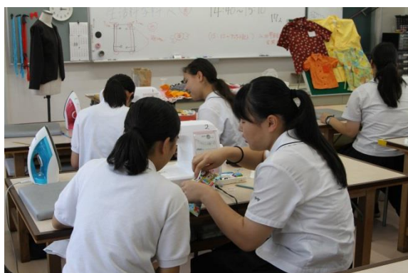
●生活科学科: 不思議なティッシュケースを作ろう!