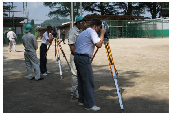
●環境工学科：測量の技術を体験しよう！