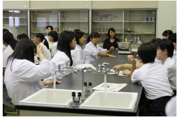
●食品工学科：食品の成分を調べよう！