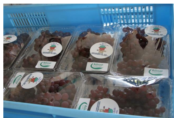
●あぐりくん: 農産物と加工品の販売