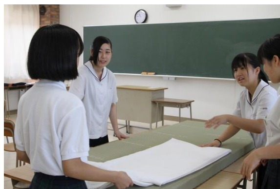
●生活科学科: いざという時の災害便利グッズを学ぼう