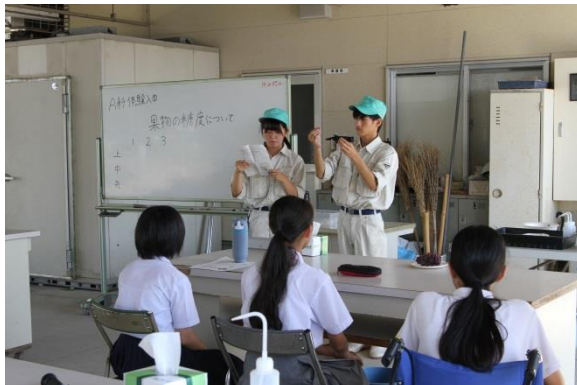
●生物生産学科:果樹の実習を体験しよう!