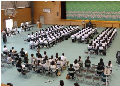
●全 体 会

また、学科別の体験学習終了後、体育館入口ピロティにて、本校の農産物と加工品の販売も行いました。