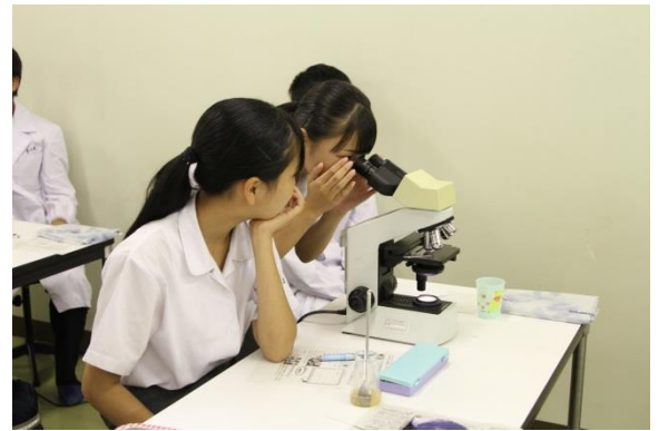
●食品工学科：微生物の働きについて学ぼう！