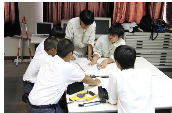
●環境工学科：樹幹投影図を作成しよう！