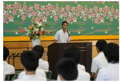
●生徒による意見発表